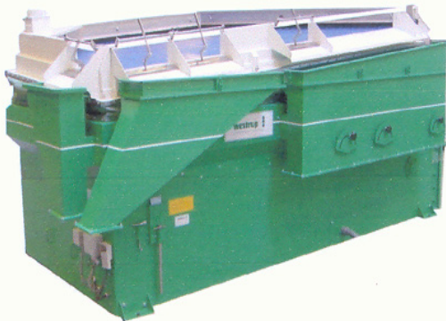
KA-3300 bis ca. 7,0 t/h KA-4400 bis ca. 12,0 t/h KA-5500 bis ca. 20,0 t/h