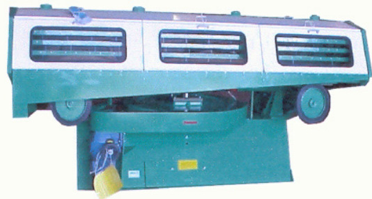
CS-30 bis ca. 3,0 t/h CS-45 bis ca. 4,5 t/h CS-60 bis ca. 6,0 t/h CS-75 bis ca. 7,5 t/h CS-100 bis ca. 10,0 t/h

Bankverbindung: Raiffeisenkasse Ohlsdorf Konto NR:26146 BLZ:34390