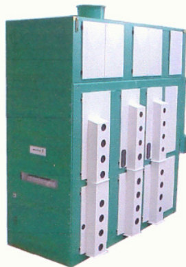
Mit 2 Siebkästen